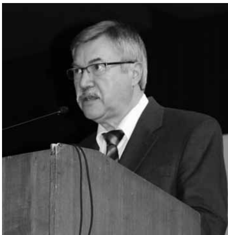
Bürgermeister Klaus Dieter Scholz