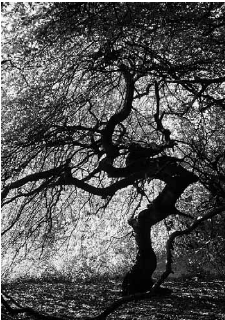
Demnächst Süntelbuchen im Steinbruch Hamelspringe?

Die jüngst bekannt gewordenen Pläne, den Steinbruch beim Ortsteil Hamelspringe mit Asche aus Industriekraftwerken wieder aufzufüllen, sind in der Öffentlichkeit auf brei-