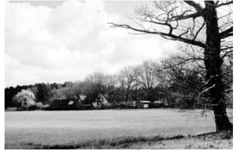
Blick auf Grafhorn