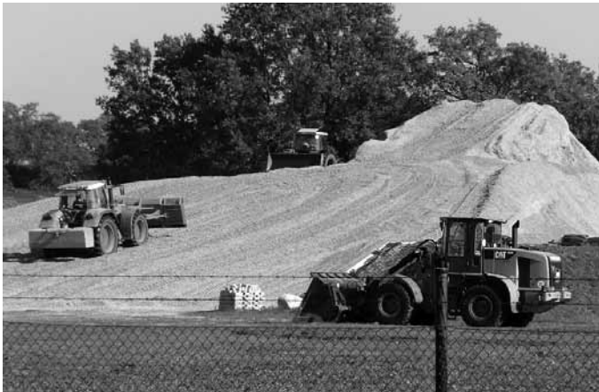
Kohlenhalde in hellgrün: So sieht Mais aus, der zu energetechnischer Biomasse aufgeschüttet ist – hier in einer Biogasanlage bei Hannover.