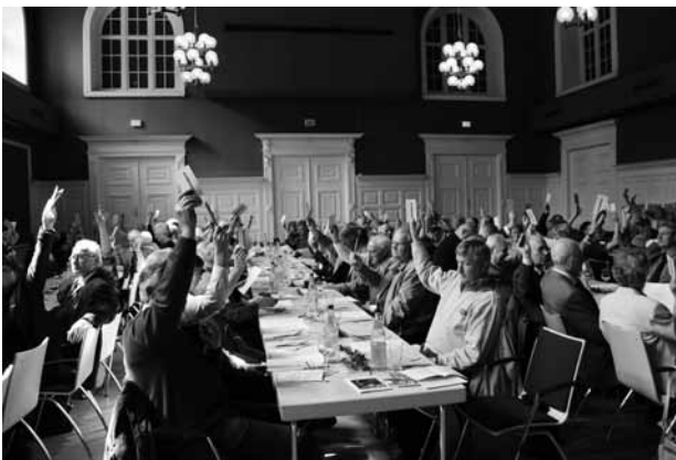
Bei der Verabschiedung der neuen Satzung.

Ein Blick auf Fotos alter Versammlungen des Verbandes und seiner Ortsgruppen mag dies belegen“, meinte Strelow. Unabhängig davon sei es für uns aber auch Pflicht, neue Mitglieder zu gewinnen. Denn zurücklehnen dürfen wir uns nicht. Der HBN verlöre seinen Sinn, wenn er nicht mehr die Ziele verfolgt, für die seine Gründer angetreten sind. Heimatpflege in einer sich wandelnden, schnelllebig