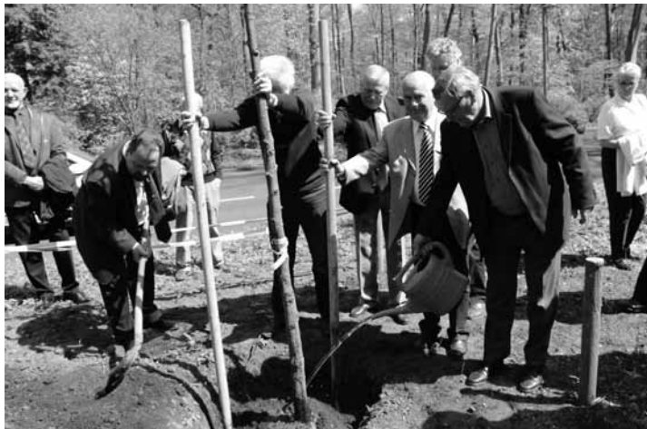
Die Stieleiche wird gesetzt

und kulturell beliebiger werdenden Welt heie ganz klar: Wir mssen lokale und regionale Antworten auf die Probleme der Globalisierung geben. Heimatpflege muss die gewachsenen kleinen Einheiten – in der rtlichen Gemeinschaft, in Sprache, Brauchtum, in den landschaftlichen Besonderheiten – bewahren.