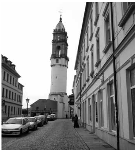
Neustadt – Schiefer Turm von Bautzen

Dass Bautzen im sorbischen Land liegt, ist unschwer an den zweisprachigen Orts- und Straßenschildern zu erkennen. Bautzens Silhouette wird vom 84 m hohen Turm des St.-Petri-Domes geprägt. Dieses Gotteshaus wird bis heute als Simultankirche, also durch katholische und evangelische Christen gemeinsam genutzt. Den Knick im Grundriss des Kirchenschiffes kann sich heute niemand so recht erklären. Vom Reichturm, der wegen seiner Neigung von 144 Zentimeter als „Schiefer Turm von Bautzen“ bekannt ist, eröffnet sich ein Blick auf eine Stadt mit insgesamt 17