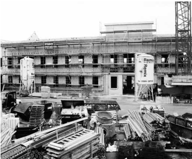
Der Wiederaufbau von Schloss Herrenhausen schreitet voran

Pünktlich zum großen 300-jährigen Jubiläum der britisch-hannoverschen Personalunion 2014 mag man sich freuen. Und man mag sich auch freuen, dass unser Landesvater David McAllister, seiner schottischen Wurzeln eingedenk, am englischen Königshof vorgestellt wurde und dem britischen Thronfolger Prinz Charles die Schirmherrschaft über dieses große Ereignis antrug. 5,5 Millionen Euro wird sich das Land Niedersachsen die Ausstellung kosten lassen – verteilt auf fünf niedersächsische Museen.