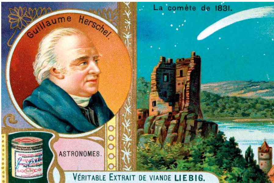
Guillaume Herschel (William Herschel) auf der Liebig-Bilderserie von 1893/94 „Véritable extrait de viande“ (Zum Bericht auf S. 55 f.)