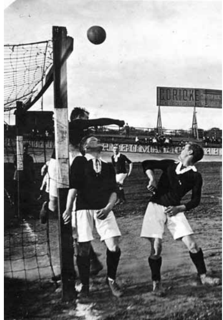
Spielszene aus einem Spiel der 1. Mannschaft gegen Viktoria 98 Berlin am 25. September 1910 in der Radrennbahn, Ergebnis: 1:1.

Von den Spielern der ersten Jahre, den ersten Vereinslokalen, der 1. Mannschaft und ihren prominenten Gegnern Hessen Kassel, Altona 93, Holstein Kiel, um nur einige zu nennen, ist vor Kurzem eine Reihe von Fotografien in das Historische Museum ge-