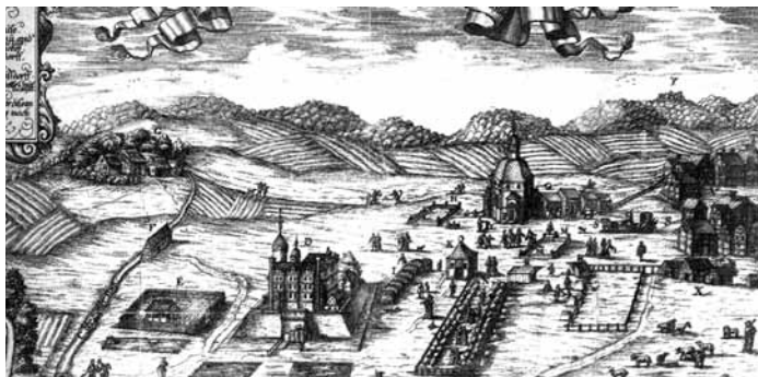
Burg Pymont. Erste Darstellung von Bad Pymont

nenhaus errichten und Pymont zu einem planmäßig Badeort ausbauen. Im Sommer 1681, dem sog. „Fürstensommer“, besuchten gleichzeitig 40 königliche und fürstliche Personen den Badeort Pymont. Es wurden mehrere schöne Kurhäuser erbaut, die noch heute das Bild des Badeortes