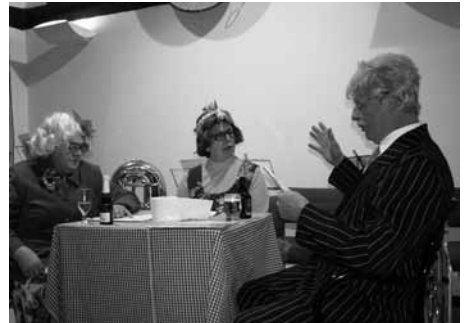
Sketch: „Anna geht zum Film“