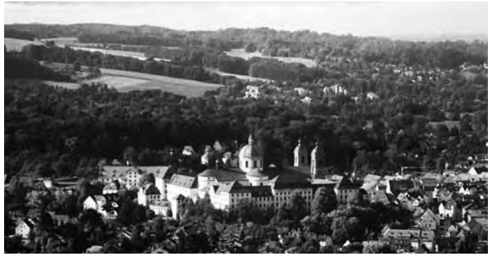
Das imposante Kloster Weingarten an der oberschwäbischen Barockstraße

Wie eine gewaltige Zitadelle thront eine Barockkirche auf dem Martinsberg nördlich von Ravensburg. 130 Meter lang ist allein das Kirchenschiff – die Basilika wetteifert mit dem Dom von Passau, größte Barockkirche nördlich der Alpen zu sein. 1865 übernahm die