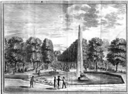
Große Fontäne, Alter Stich von Markard 1784

Die Stadt Bad Pyrmont prüfte den Antrag und stellte fest, dass eine alleinige Beantragung erst in zehn oder zwanzig Jahren zum Ziel führen könnte. Im Rahmen der Prüfung tat sich allerdings ein anderer, Erfolg versprechender Weg auf. In einer Vergleichsstudie zur Aufnahme in die Liste der Weltkulturerbestätten unter dem Titel: Europäische Kurstädte und Moorbäder, 2010 im Auftrag der Stadt Baden-Baden von Dr. Andreas Förderer zusammengestellt, findet sich nämlich auch Bad Pyrmont erwähnt. Neben der Kerngruppe mit den Badeorten Bath (GB), Spa (B) die böhmischen Bäder Karls-, Franzen- und Marienbad, Baden-Baden (D) und Vichy (F), zählt Dr. Förderer auch die Bäder: Wiesbaden (D), Bad Nauheim (D), Bad Ems (D), Bad Kissingen (D), Aixles-Bains (F), Evian-les Bains (F), Baden bei Wien (A), Ischl (A) Montecatini (I) und natürlich auch Bad Pyrmont zum Kreis der Weltkulturerbekandidaten.