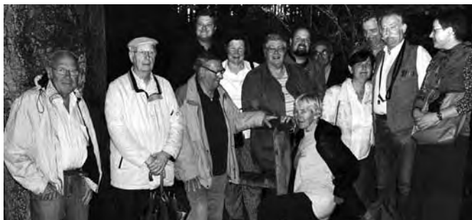
Die Wandergruppe an der historischen Furt der „Wulbeeke“