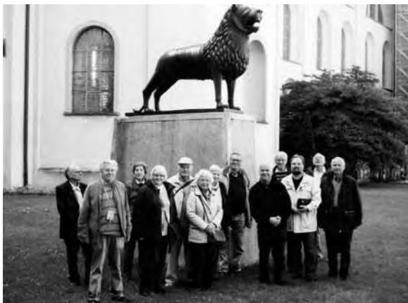
Ein Teil der niedersächsischen Gäste vor dem „Welfenlöwen“ im Stift Weingarten

„Auf den Spuren der Welfen“ war das Motto einer Mehrtagesfahrt des HBN, die vom 20. bis 23. August nach Württemberg und Bayern führte. Besichtigt wurde das Kloster Weingarten als einstiger Stammsitz des Welfengeschlechtes (vgl. Aufsatz in diesem HL auf S. 128) ebenso wie das „Welfenmünster“ in Steingaden. Zudem erfreuten sich alle Fahrtteilnehmer an dem überwältigenden Blick auf die Alpen, der sich auf der