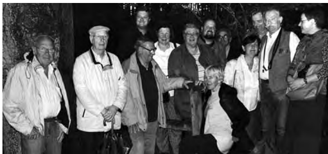
Die Wandergruppe an der historischen Furt der „Wulbeeke“