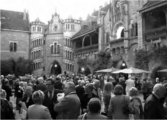
Der Hof der Marienburg war dicht gedrängt gefüllt.