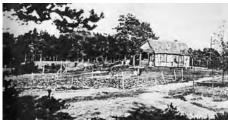
Aufnahme der historischen Jagdhütte, in der Löns den „Wehrwolf“ schrieb.