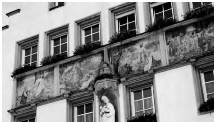
Die „Welfensage“ am Portal des Weingartener Amtshauses

Georg V. war ein romantischer Geist und fühlte sich dem Denkmalschutz verpflichtet.