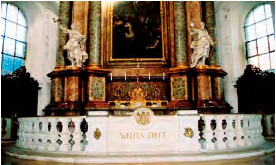
Der Heilig-Blut-Altar im Nordschiff der barocken Basilika von Weingarten in Baden-Württemberg. Vor dem Altar befindet sich der Zugang zu der 1859/60 durch König Georg V. erneuerten Welfengruft. (Zum Bericht auf S. 128).