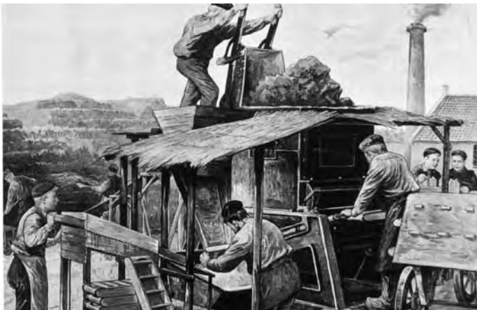
Trockengebäude der Ziegelei Kruse Neustadt-Nöpke

c) Umsätze: Die stark schwankenden Jahresdurchschnitte verzeichneten für die Zeit vor 1740 Zahlen von 200–540 Talern. Sie stiegen bis 1800 auf über 1000 Taler, fielen in der Zeit der französischen Besetzung auf 400–500 Taler zurück, um von 1814 bis 1840 auf