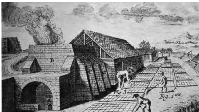
Feldbrandofen Anfang 18. Jht. Aus Schyja S. 47

Auf dem Areal westlich des Annateichs (heute Hannover-Kleefeld) bestanden zwei städtische Ziegeleien, Breitenwiese-Ziegeleien genannt, weil sie im Südteil der früheren Breiten Wiese lagen. Es bestanden die alte Anlage an der Kirchröder Straße von 1714 bis 1861 und ca. 500 m nördlich davon ein neueres Werk von