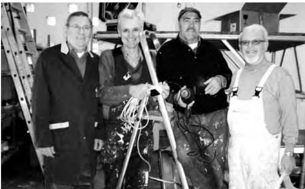
Es geht voran!

Der „Pinkenburger Kreis“ ließ auf viele Worte Taten folgen und pachtete im Sommer 2009 das ca.