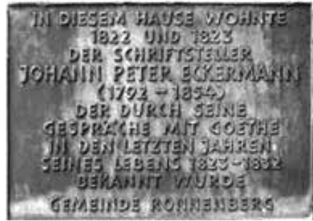
Gedenktafel am Wohnhaus Eckermanns in Empelde.