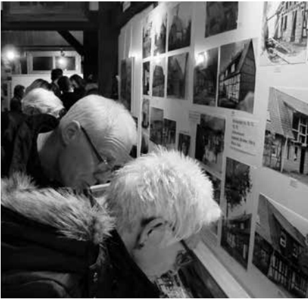
Großes Interesse anlässlich der Ausstellungseröffnung.

rum, wahrscheinlich an der Stelle eines alten germanischen Gräberfeldes.