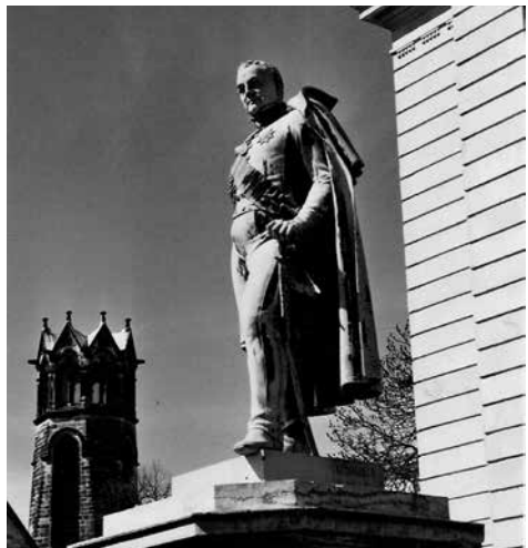
Denkmal für General Carl v. Alten (1764–1840) vor dem Niedersächsischen Landesarchiv. Als Kommandeur der „King's German Legion“ hatte der Hannoveraner entscheidenden Anteil am Sieg von Waterloo.

Zu der Veranstaltung sind alle Mitglieder herzlich eingeladen. Bringen Sie auch interessierte Freunde mit. Anmeldung bis 5. Juni bitte in der HBN-Geschäftsstelle in Langenhagen, Tel. 0511/323490.