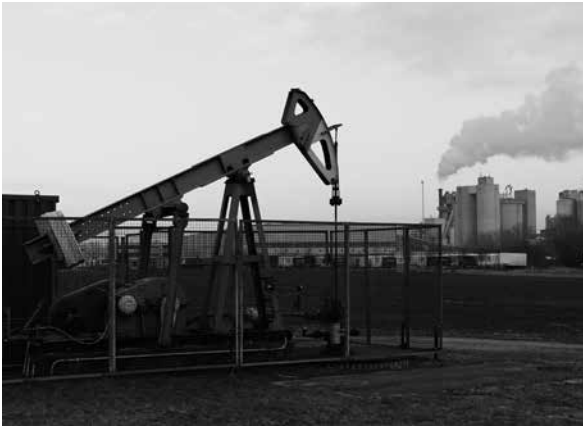
Ölpumpe in der Flur von Höver.