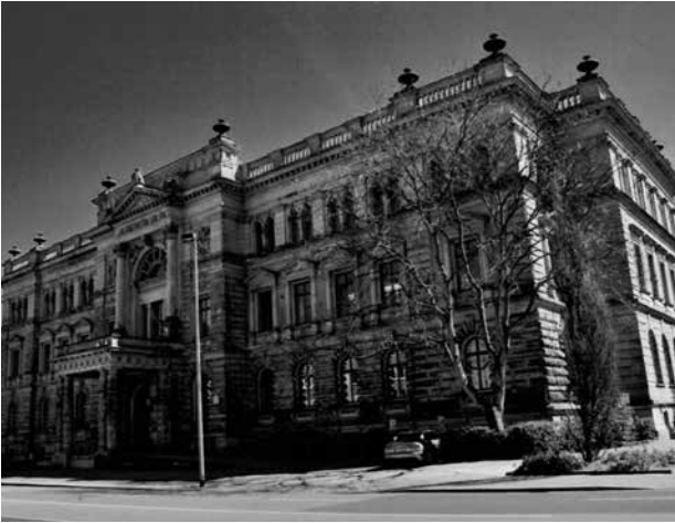
Das ehemalige hannoversche Ständehaus.