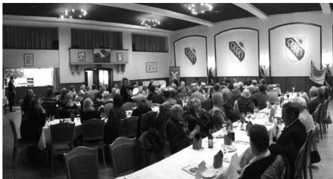
Im altvertrauten Saal von Gasthaus „Dehne“.

Nach dem Vortrag widmete man sich der zutrefflich gelungenen heimischen Heidschnucke aus Dehnes Küche. Und nach gutem Brauch erhoben sich am Ende des Treffens alle Anwesenden, um „Kein schöner Land“ und das Niedersachsenlied anzustimmen. HL