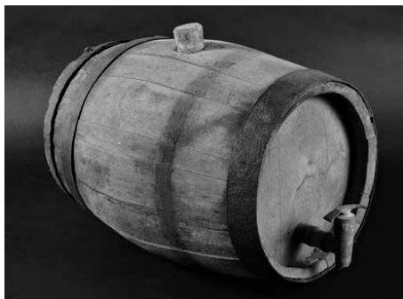
Schnapsfass von einem Bauernhof in Nettelrede

Die Ausstellung befasst sich vor allem mit der Rezeption dieser neuen Genüsse im ländlichen Bereich, wo beispielsweise das Kaffeetrinken im 18. Jahrhundert obrigkeitlich unterbunden werden sollte. Der Branntwein stellte hingegen im 19. Jahrhundert ein