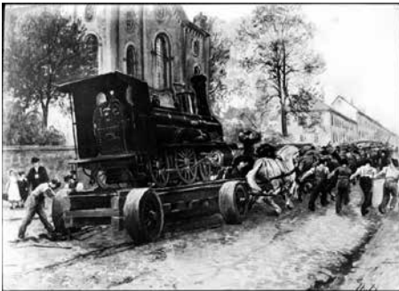
Transport einer Lok per Pferdewagen von der Fabrik zum Bahnhof (hier mit 100 Pferden in Kassel).

Ein Stück hannoversche Stadtgeschichte auf Plattdeutsch