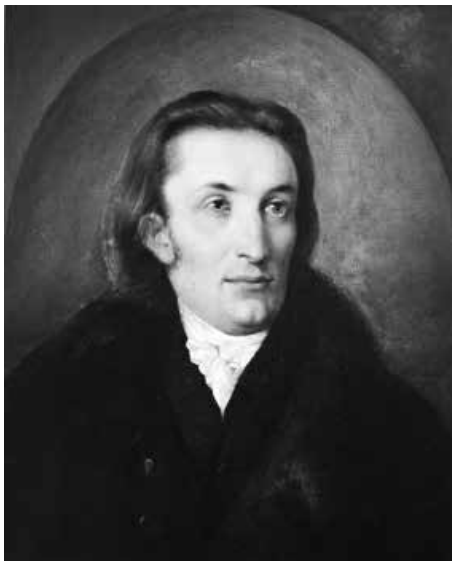
Johann Peter Eckermann. Gemälde von Johann Joseph Schmeller, 1824

Angeregt durch einen kulturell interessierten Kollegen- und Freundeskreis kommt er zur Literatur. Man schwärmt für Theodor Körner, Friedrich Gottlieb Klopstock und Friedrich Schiller. Eckermann beginnt selbst Verse zu dichten und verfasst anlässlich der rückkehrenden, siegreichen Truppen ein Gedicht auf die Schlacht bei Waterloo: „Der 18 Juni 1815. Den braven Jägern gewidmet“. Er ließ es als Flugblatt verteilen, es wurde in der Zeitung gedruckt und soll sogar vertont worden sein. Er erhielt allseits lobende Anerkennung, man wurde auf seinen Namen auf-