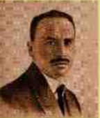
Börries von Münchhausen